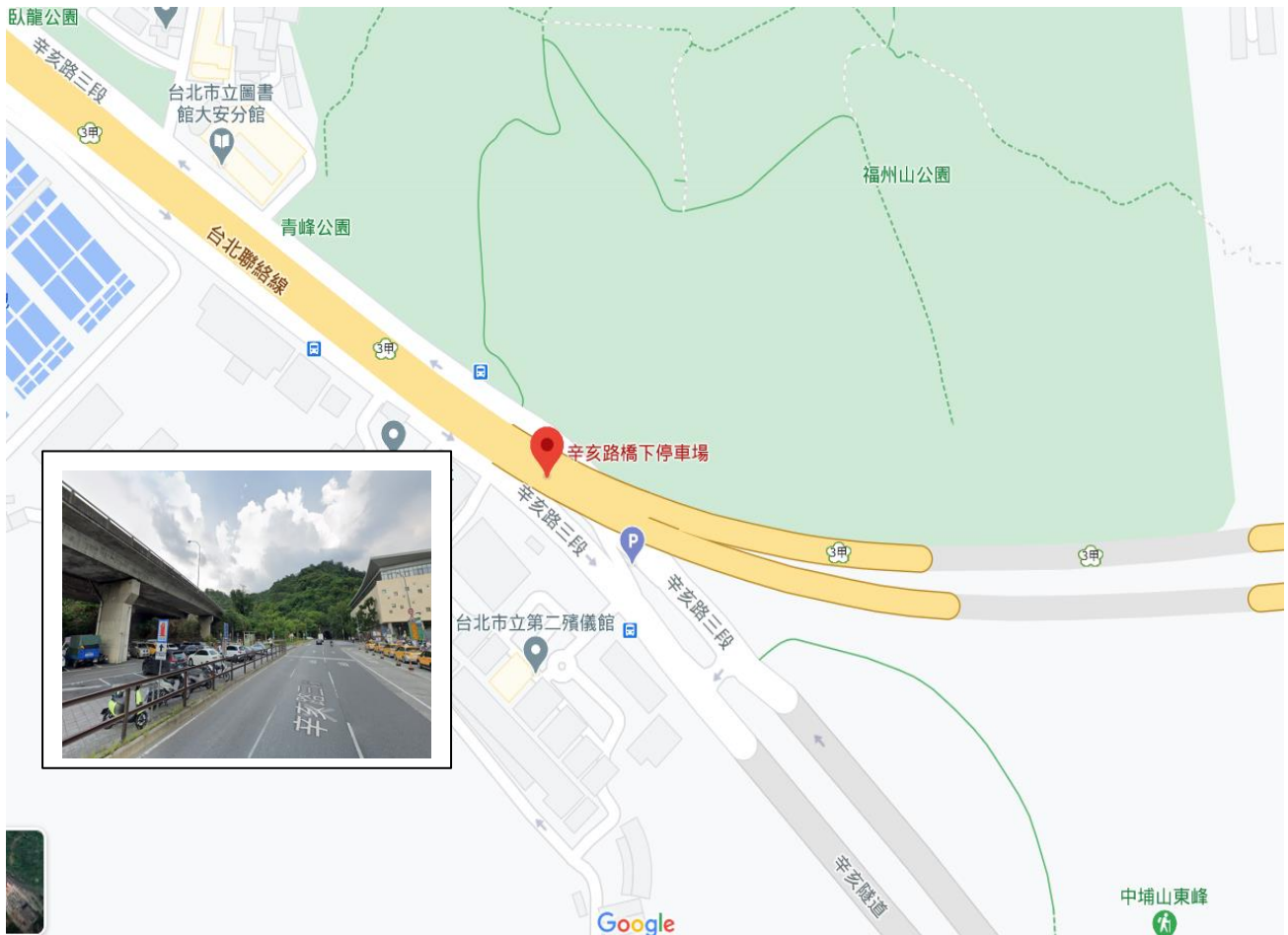
台北聯絡道辛亥路高架橋下停車場示意圖